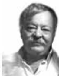
γράφει ο Βασίλειος Σιαμέτης*

Ένας ακόμη Χρόνος εγκαταλείπει το παρόν και καταλαμβάνει την θέση του Στην ΙΣΤΟΡΙΑ (στο Παρελθόν)!!!