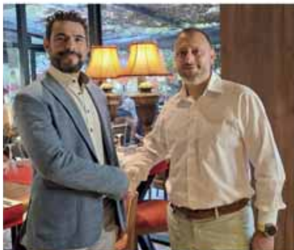
ΜΑΖΙ ΜΕ ΠΡΟΕΔΡΟ ΤΟΝ ΜΙΧΑΛΗ ΑΡΓΥΡΟΥΔΗ

✓ Είναι η στιγμή, που είναι αναγκαίο, να δώσουμε ένα σαφές και ηχηρό μήνυμα αισιοδοξίας, ελπίδας, ανάνεωσης, διαλόγου και πραγματικού αγώνα, ενωμένοι σαν ένα, απέναντι σε όλα τα προβλήματα, αλλά πολύ περισσότερο στις προοπτικές, τις οποίες μπορεί να μας παρέχει η χώρα μας, προς όφελος για τις επόμενες γενιές!