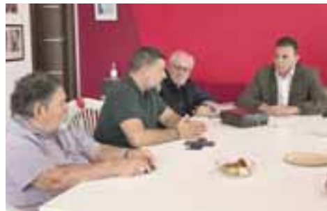
Ο Γ. Καραμέρος με το Σωματείο Εργαζομένων του Δήμου.

Ο Βουλευτής συναντήθηκε ακόμη με την Ομοσπονδία Πολιτιστικών Συλλόγων Σπάτων-Αρτέμιδας στο Πολιτιστικό Κέντρο Αρτέμιδας, ενώ ενημερώθηκε από τον Επιστημονικό