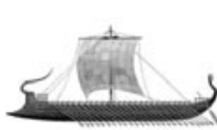
Ελληνική «Αργώ» πεντηκόντορο εμβολοφόρο πλοίο.

Η Μυθολογία ενός λαού εντάσσεται στην ΠΡΟ-ΙΣΤΟΡΙΑ του, πριν από την ανακάλυψη της γραφής. Οι μυθικές διηγήσεις έχουν να κάνουν με εκστρατείες εξάπλωσης των ελληνικών πόλεων στην ευρύτερη περιοχή και προπαντός σε παράκτιες περιοχές (Ιωνία, Εύξεινος Πόντος, Μεσόγειος).