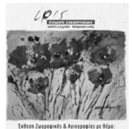
Έκθεση Ζωγραφικής & Αιογραφίας με θέμα:

Κατερίνα, Πατέλη Αθηνά, Προβιά Μαίρη, Σπανοπούλου Μελίνα, Σπανουδάκη Μαρία, Στρατηδάκη Πελαγία, Ταμπάκη Θωμαή, Τρανάκου Κατερίνα, Τσεβά Ρίτα, Φουντά Έφη.