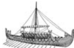
Ντράκαρ (σουηδικά drakkar) A. Brun - Noveau Larousse Illustré

Εξάλλου το Αρχαίο Ελληνο-Αγγλικό λεξικό των Henry Liddell και Robert Scott , έκδοση 1843, στο λήμμα ΜΥΘΟΣ (Γ' τόμος, σελ. 194), δίνει τις εξής σημασίες: λόγος, ομιλία, αγόρευση, συμβουλή, απόφαση, σκοπός, σχέδιο. ΜΥΘΟΣ σε αντίθεση με το ΕΡΓΟΝ . Πουθενά δεν αναφέρεται η σημασία παραμύθι ή πλαστή διήγηση, που στα Αρχαία Ελληνικά λέγεται ΠΑΡΑ-ΜΥΘΟΣ (ο) = contra-Myth. Στα Ομηρικά Έπη δεν απαντάται η λέξη ΛΟΓΟΣ , διότι έχει αντικατασταθεί από τον ΜΥΘΟ και το ΕΠΟΣ!