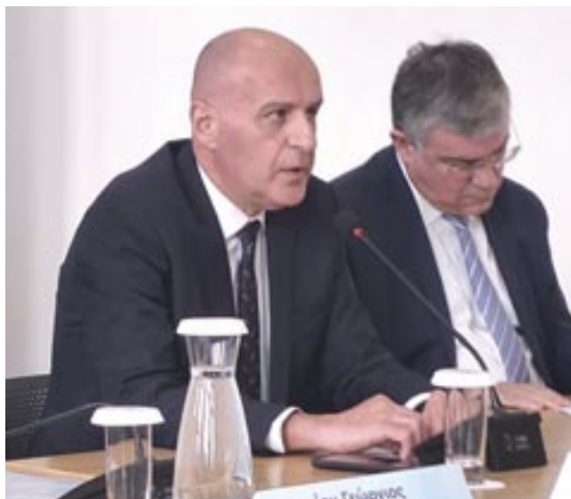
Χαιρετισμό από τον Δήμαρχο Σπάτων-Αρτέμιδος, Δ. Μάρκου.

σιμης για την περιβαλλοντική προστασία και την αναβάθμιση των υπηρεσιών προς τους δημότες. Πρόκειται για ένα σημαντικό έργο για την περιοχή μας, που βρίσκεται σε πορεία υλοποίησης».