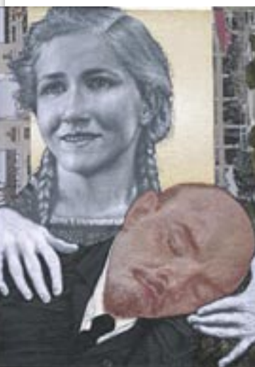
Εμμανουήλ Μπιτσάκης, Η παρηγοριά, 2017, Συλλογή Σωτήρη Φέλιου.tif

Σάββατο & Κυριακή: 10:30 π.μ. - 13:00 & 18:00 - 20:30