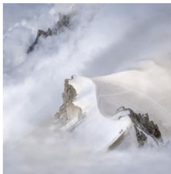
Slovakia, Winner, Regional Awards, Sony World Photography Awards 2025