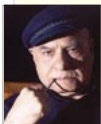
του Κώστα Βενετσάνου

Για τον ποιητή, για κάποιους όμοιους. Γι' άλλους, ο πλούτος και η εξουσία. Τους αρκεί να μιλούν «απαίστως» την «διάλεκτον» της ελληνικής, την αγγλική 1 . Αλλά και αγγλικά να μιλούν χωρίς να το γνωρίζουν, ελληνικά ομιλούν και μάλιστα ενίοτε ...ομηρικά: «kiss me», (= φίλησέ με), Ομήρου, Ιλιάδα : «κύσον με» (Ω 478 κύσε χείρας).