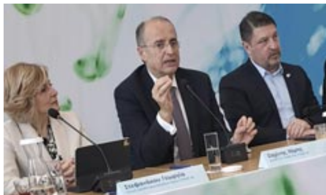
Χαιρετισμό από τον Διευθύνοντα Σύμβουλο της ΕΥΔΑΠ, Χ. Σαχίνης

Ο Περιφερειάρχης Αττικής, Ν. Χαρδαλιάς τόνισε ότι: «Μετά από πολλά χρόνια, η Ανατολική Αττική αποκτά ένα σύγχρονο και λειτουργικό δίκτυο αποχέτευσης, βάζοντας τέλος σε μια απαράδεκτη κατάσταση δεκαετιών σε μια περιοχή που έχουν την έδρα τους μεγάλες παραγωγικές μονάδες, το διεθνές αεροδρόμιο, ενώ κάθε καλοκαίρι το παράκτιο μέτωπο φιλοξενεί χιλιάδες επισκέπτες. Το συγκεκριμένο έργο αποτελεί ένα ακόμα βήμα στην προσπάθειά μας για ισόρροπη ανάπτυξη σε κάθε έναν από τους 66 Δήμους της Μητροπολιτικής Περιφέρειάς μας. Γιατί για εμάς, η δημιουργία ολοκληρωμένων δικτύων αποχέτευσης και ύδρευσης σε κάθε πόλη, σε κάθε γειτονιά της Αττικής, είναι αναπόσπαστο μέρος του ολιστικού στρατηγικού σχεδιασμού μας για μια Περιφέρεια ανθρώπινη, πράσινη, βιώσιμη, με έντονο αναπτυξιακό πρόσημο και με ποιότητα ζωής για όλους, χωρίς αποκλεισμούς και εξαιρέσεις».