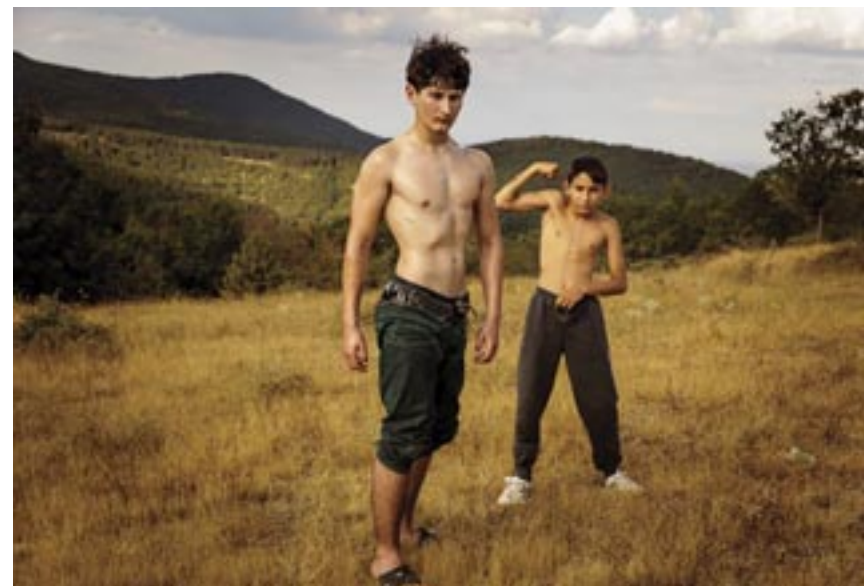
© Panagiotis Rontos, Greece, Winner, Regional Awards, Sony World Photography Awards 2025

Παναγιώτης Ρόντος (Ελλάδα), Νικητής Yavor Michev (Βουλγαρία), Shortlist