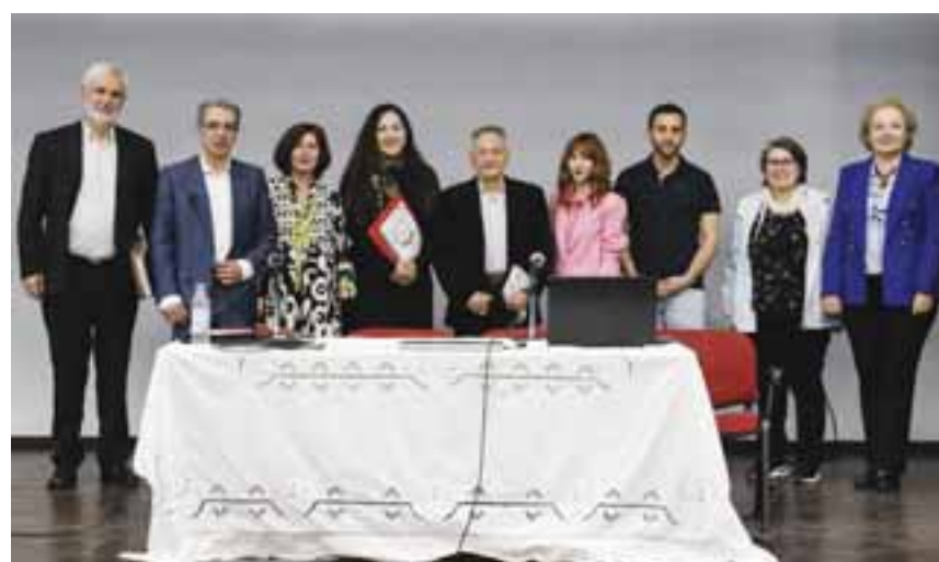
Το Ελληνικό Κέντρο Τέχνης και Πολιτισμού πραγματοποίησε την 4η Ημερίδα Τοπικών Ερευνητών Μεσογείων και ΝΑ Αττικής, στις 31 Μαρτίου 2024.

Για την καλύτερη συνεργασία μεταξύ της Περιφέρειας Αττικής και της Πρεσβείας της Λαϊκής Δημοκρατίας της Κίνας στην Ελλάδα συμφωνήθηκε η συγκρότηση πενταμελούς ομάδας εργασίας , με στόχο τη δρομολόγηση και διασύνδεση ενός κοινού προγράμματος δράσεων και παρεμβάσεων.