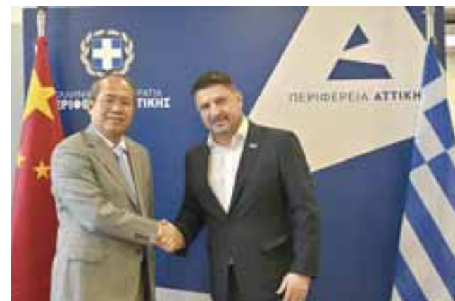
Ο πρέσβης της Λ. Δ. της Κίνας Σιάο Τζουντσένγκ με τον Περιφερειάρχη Αττικής Νίκο Χαρδαλιά

Από την πλευρά του, ο πρέσβης της Λαϊκής Δημοκρατίας της Κίνας στην Ελλάδα επανέλαβε τη βούληση της χώρας του για περαιτέρω εμπάθυση της διμερούς συνεργασίας και υπογράμμισε ότι θα συμβάλει στην περαιτέρω διεύρυνση των αδελφοποιήσεων. Ο Σιάο Τζουντσένγκ τόνισε το ενδιαφέρον που υπάρχει για νέες επενδύσεις στους κλάδους των υποδομών, των νέων τεχνολογιών, των λιμένων και της ενεργειακής μετάβασης. Προσκάλεσε, επίσης, τον Περιφερειάρχη Αττικής, Νίκο Χαρδαλιά , να επισκεφθεί