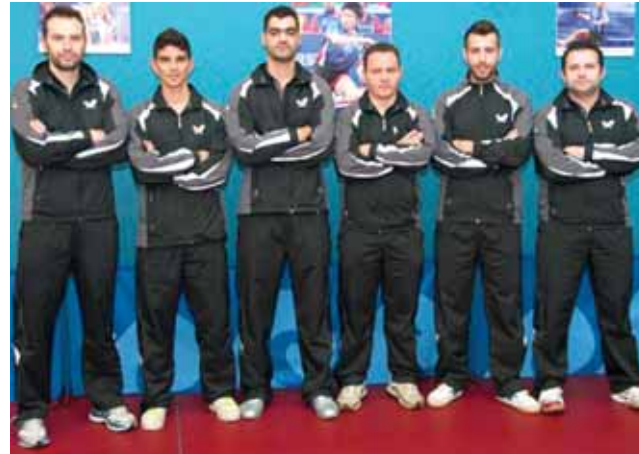
Η ομάδα του ΑΡΗ ΒΟΥΛΑΣ που αγωνίζεται στην Α2 κατηγορία

Αυτή είναι και η άγρια ομορφιά του αθλήματος που